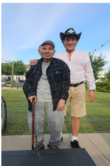
Техас, АҚШ. Демалыс, ұлымен.