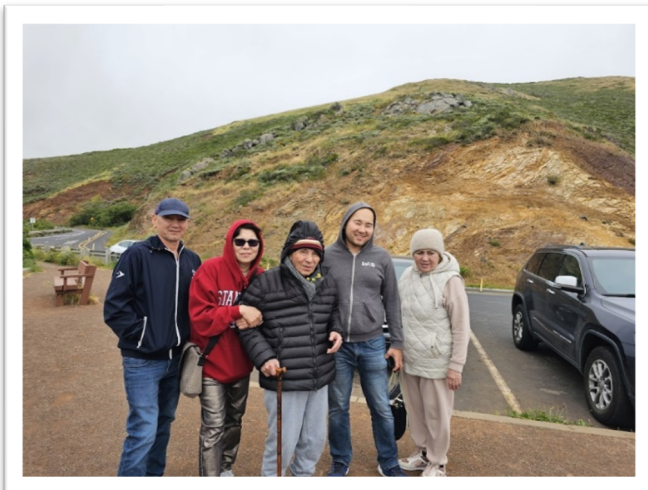
АҚШ - Төрехановтар әулеті

Қымбатты көрермендерім оқырмандарым - қызықты, тарихи ескерткіш мұраларын көруге көзі де көңілге тоймайды екен, ой, Дүние-ай!