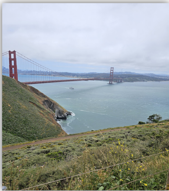
Алтын көпір, Калифорния АҚШ.

Ия бұл Алтын көпір бір тарих! Жағдайым болса, «Америкаға бір сапар» атты көлемді Естелік жазуымда ойда бар.