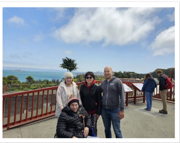
Алтын көпір үстінде!

Қымбатты көрермендерім оқырмандарым - қызықты, тарихи ескерткіш мұраларын көруге көзі де көңілге тоймайды екен, ой, Дүние-ай!